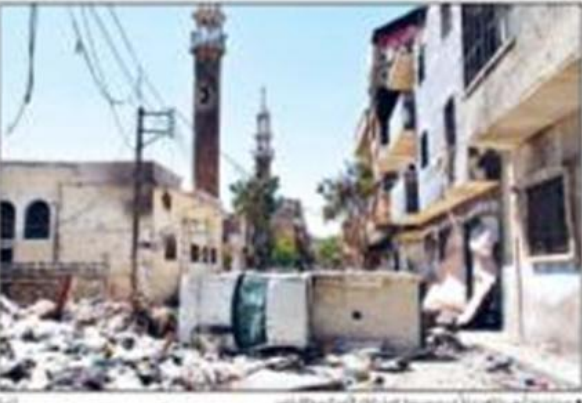
صورة من مدينة بيروت في سوريا بعد انتهاء القتال في المنطقة.

أمام مجلس الأمن الدولي، دعا الأمين العام بان كي مون إلى اتخاذ إجراء دولي بموجب الفصل السابع من ميثاق الأمم المتحدة للتعامل مع الوضع في سوريا. وقال إن الوضع في سوريا غير مقبول ولا يمكن تجاهله.